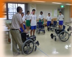
中学生サマーワーク

市内の小中学生を対象として夏休み期間中に特別養護老人ホームでボランティア体験活動を行っています。また、福祉教育推進のため、市内小中学校へ福祉体験の出前講座を行っています。