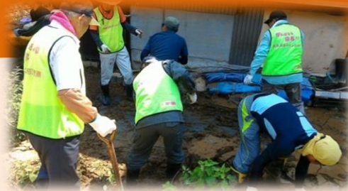
災害ボランティア活動

ボランティア活動に興味のある方やボランティアを必要とする方からの相談・受付を行っています。ボランティア研修会を開催し、ボランティア活動の普及、啓発活動を行っています。また、災害時には被災地へ出向き、ボランティア活動を行っています。