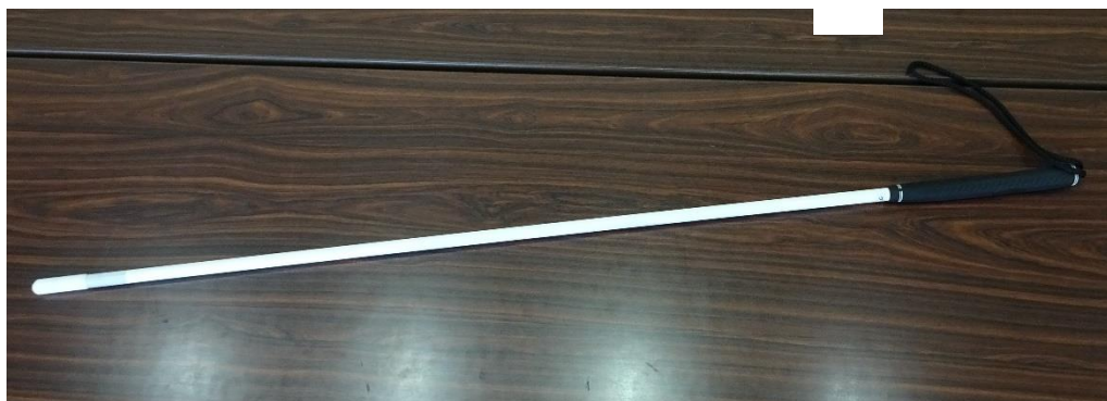
白杖 (最大貸出数 15本)