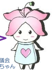
南魚沼市社会福祉協議会 キャラクター みなみちゃん