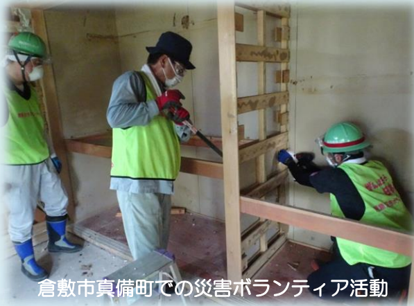
倉敷市真備町での災害ボランティア活動

ボランティア活動に興味のある方やボランティアを必要とする方からの相談・受付を行っています。ボランティア研修会を開催し、ボランティア活動の普及、啓発活動を行っています。また、災害時には被災地へ出向き、ボランティア活動を行っています。