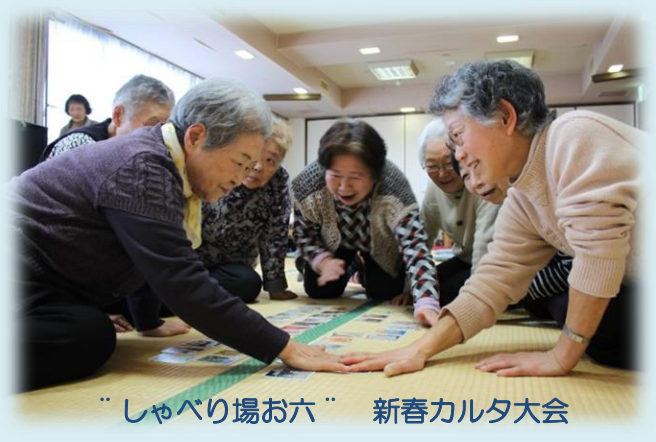
“しゃべり場お六” 新春カルタ大会

高齢者の方が地域で元気に暮らせるように、互いに支え合う関係づくりを行うふれあい・いきいきサロンなど地域住民の自主的な活動を支援します。毎週月曜日に定期型お茶の間サロン“しゃべり場お六”を南魚沼市福祉センターしらゆりで開催しています。