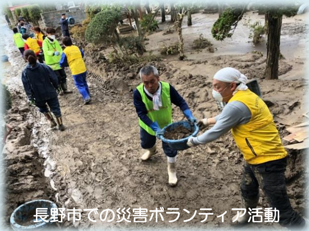
長野市での災害ボランティア活動

ボランティア活動に興味のある方やボランティアを必要とする方からの相談・受付を行っています。ボランティア研修会を開催し、ボランティア活動の普及、啓発活動を行っています。また、災害時には被災地へ出向き、ボランティア活動を行っています。