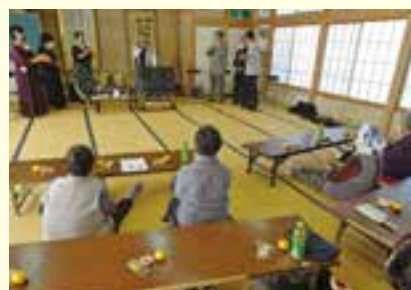
あじさいクラブの演芸鑑賞の様子

なかなか会えないけれど、サロンに来れば顔を見れたり、和気あいあいとお喋りしたり、イベントを楽しめたりと、サロンは楽しみと生きがいの両方を味わえると思います。