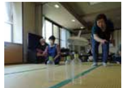
ボトル倒しの様子

※状況により、 内容を変更する場合があります。 ※運営スタッフや皆さんで楽しめる演芸(歌、手品など)を披露して下さるボランティアを募集しています! 😊 ご興味がある方は、是非見学にいらしてください。