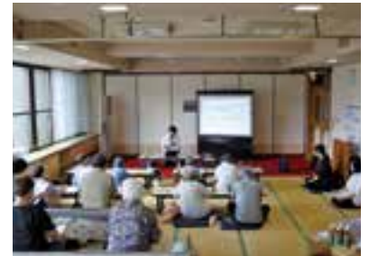
ウエルシア薬局さんの「正しい手洗い方法」講座の様子

“しゃべり場お六”の様子を随時facebookに掲載していますので、ご覧ください。