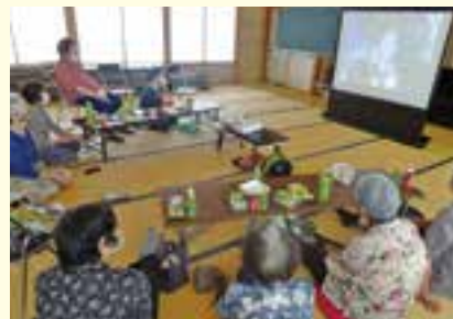
美空ひばりDVD鑑賞の様子

地域の方やボランティアによる三味線などの演芸披露やDVD鑑賞なども取り入れ、芸能を楽しみに出掛けることが難しい方もサロンで楽しめるようにしたりと、みんながいきいきと出来る活動内容を心掛けています。