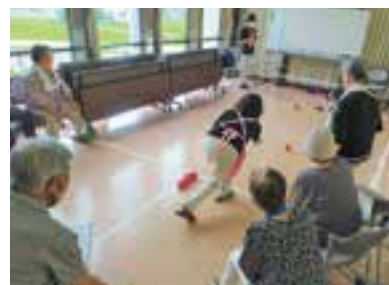
大好評！ボッチャ大会の様子