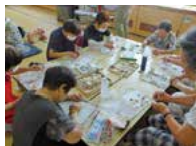
簡単！かわいい♡貝殻アートの様子

“しゃべり場お六”の様子を随時facebookに掲載していますので、ご覧ください。