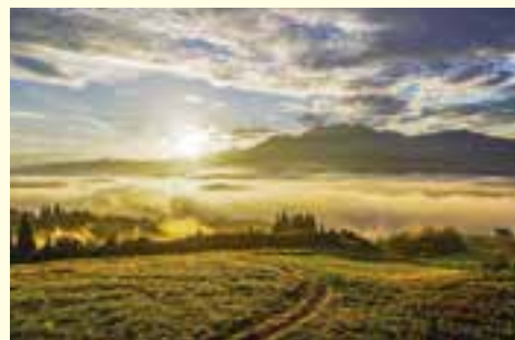
五日町スキー場よりのぞむ雲海と朝日

市外から南魚沼市へ移住して来ました。15年程前からカメラが趣味で、我が子以外のテーマで撮りたいと思っていたところ、南魚沼市には地元の人でも知らなかった素晴らしい風景などが沢山あることを知りました。以来、雲海などの風景を撮っては友人に紹介していました。数年前、市報に市民カメラマン募集があり応募、採用され、休日等に活動を始めることにしました。