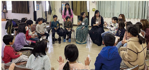
英語で自己紹介ゲーム

「Global Friends」は、月に数回週末に大和公民館で開催しています。おじゃました日は、インド出身の留学生さん3名がインストラクターとして、インドの文化やカラフルなインドのお祭り「ホーリー」について、動画等を用いながら英語で紹介されていました。子どもたちは興味津々。鳥のイラストに、ホーリーで使う色粉で色づけ体験も行いました。さまざまな国のお友達と国際交流ができる貴重な機会かと思います。興味のあるお子様は、一度参加されてはいかがでしょうか？ 詳しくは地域福祉係（☎773-6911）もしくは、Global FriendsのInstagramアカウント (@globalfriends_minamiuonuma) までお問合せください。