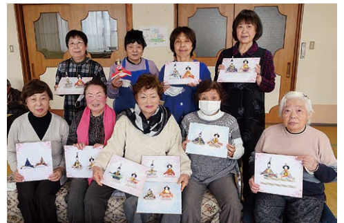
今年もステキ♡ひなかざり作りの様子

※状況により、 内容を変更する場合があります。 ※運営スタッフや皆さんで楽しめる演芸（歌、手品など）を披露してくださるボランティアを募集しています！😊 ご興味がある方は、ぜひ見学にいらしてください。