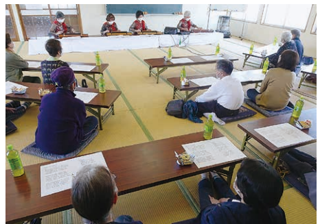
大正琴演奏の様子