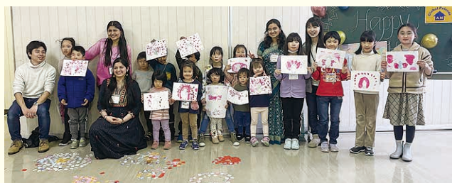
色粉を使って作品が完成