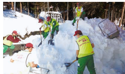
塩沢中学校の皆さん

当会では、随時除雪ボランティアさんを募集しています。ご希望の方は、問合せ先までご連絡ください。