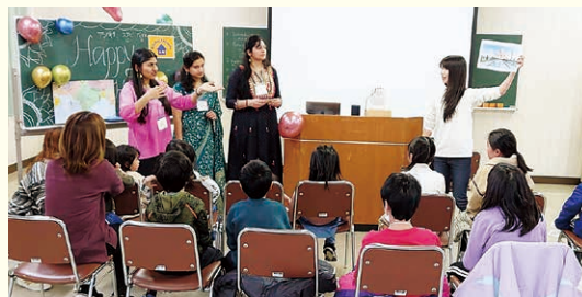
インドについて英語で聞いてみよう