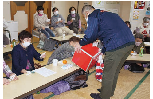
新春ビンゴ大会の様子